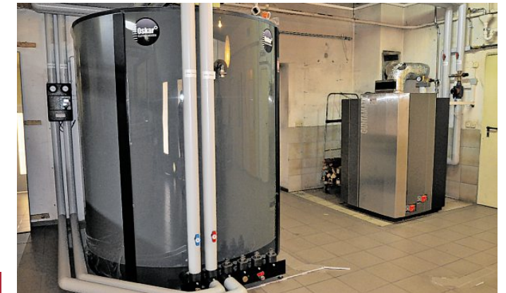
Ein Schichtspeicher mit 3000 Liter Fassungsvermögen (links) pumpt Wärme dann in den Heizkreislauf, wenn sie benötigt wird.

➤ Weitere Infos im Internet www.shk-makosch.de