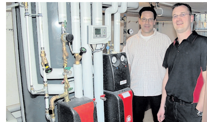
Im Keller wurde die neue Gasbrennwert-Heizung installiert.