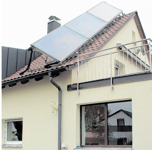
Eine Ost-West-Neigung des Daches verhindert noch lange nicht die Montage einer Solaranlage.

Markus Makosch macht als findiger Firmenchef auch das scheinbar Unmögliche möglich