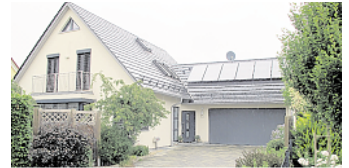
Rund 35 Prozent der Heizenergie pro Jahr produziert die Solaranlage der Familie Weini.