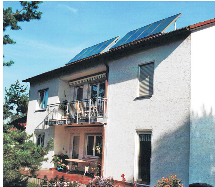
Eine 17 Quadratmeter große, aufgeständerte Solaranlage unterstützt die Pelletsheizung und sorgt auch im Sommer für warmes Wasser.