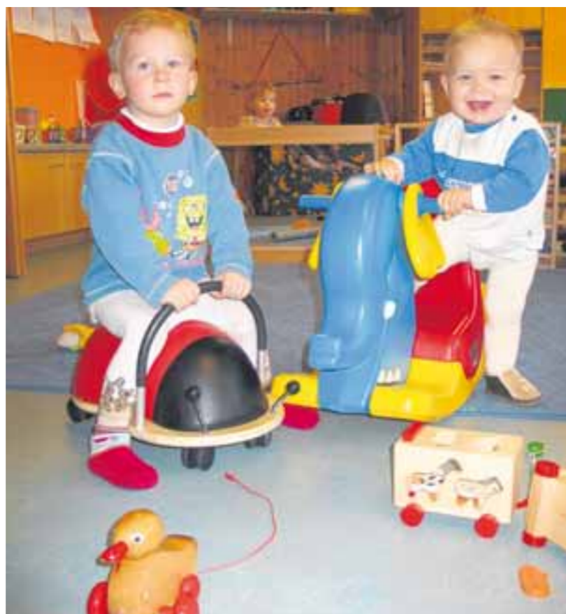
Die beiden haben gut Lachen. Denn ihre Eltern zahlen für den Imhof-Kindergarten in Untermeitingen ab September bald die niedrigsten Gebühren auf dem Lechfeld. Das Gleiche gilt für die anderen Einrichtungen der Gemeinde.

● Kindergartenbeiträge Die Kindergartenbeiträge für Kinder unter drei Jahren sollen in Obermeitingen nicht über denen der Nachbargemeinden liegen, forderte Gemeinderätin Anita Schummer. Das Thema soll in der nächsten Sitzung behandelt werden (siehe hierzu auch den nebenstehenden Artikel).